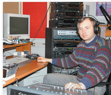
Радиостудия, Москва, 2005

и энтузиазмом, и удивительным образом справлялись. Служение разрасталось вследствие огромного духовного голода у населения бывшего Советского Союза. Помимо радиовещания на страны СНГ, с 1994 года стали открывать центры помощи зависимым людям «Дома Пиркко», а с 1995 года – издавать журнал «Евангелие за колючей проволокой». На сегодня этот журнал является самым востребованным и узнаваемым духовным изданием в тюрьмах.